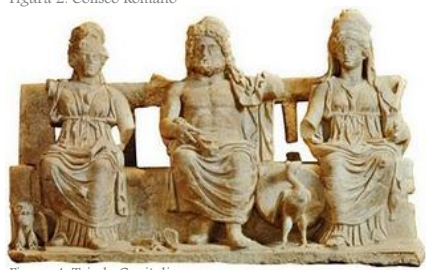
Figura 4. Triada Capitolina