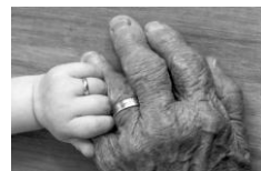
Figura 18. El tacto