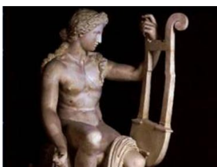
Figura 6. Apolo

Es así como se conforman los tres pilares de la cultura representados en los tres edificios del Centro de Recursos Educativos.