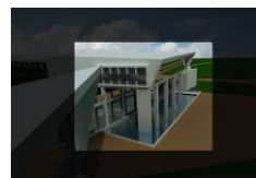
Figura 13. Agua