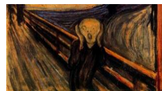
Figura 17. El grito