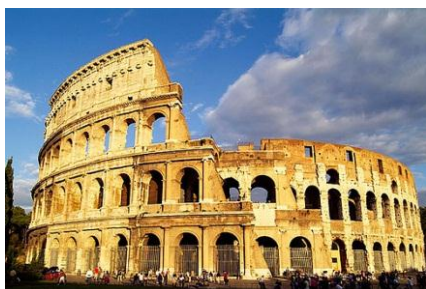
Figura 2. Coliseo Romano

La triada capitolina, está formada por la agrupación de tres de los dioses más poderosos del mundo romano: Apolo, Juno y Minerva, que a su vez representan gran cantidad de conceptos filosóficos y de la naturaleza, de los que en el proyecto se escogieron tres por cada Dios y se hizo una comparación con cada una de las tres construcciones que a la postre configuran el complejo edificio.