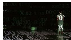
Figura 19. Imagen

El primer sentido, tiene su representación en el primer edificio del conjunto, en la medida en que es el lugar donde predominan los espacios utilizados por niños pequeños, los cuales se comunican y entienden el mundo, más que cualquier persona a través del tacto y la comprobación directa de sus manos y su boca.