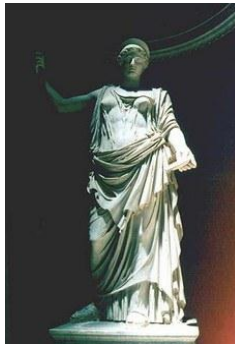
Figura 11 Juno

En segundo lugar se encuentra la diosa de la naturaleza que para el caso de la filosofía del proyecto, se divide en los diferentes elementos que la componen, como son: el agua, el aire y la tierra.