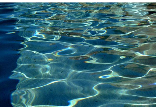
Figura 12. Agua

El agua como principal elemento de la vida está representada en el edificio número dos, en su parte formal, ya que descansa, por medio de los pilares que la soporta, sobre un gran estanque que tiene como función refrescar el conjunto, así como servir de espejo que refleja sus formas en el día y en la noche.